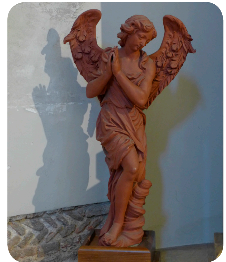
Angelo in terracotta situato nella Basilica di San Nazaro in Brolo in corso di Porta Romana Milano.