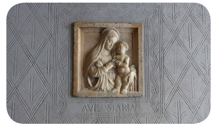
Chiesa di Sant'Angelo in via Moscova a Milano, Madonna con Bambino quattrocentesca in marmo ad opera di Francesco Solari. Inserito su una parete con decorazione a graffito.