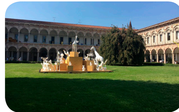
"Survival" simbolica zattera di sopravvivenza per 40 animali-lampade nel Cortile d'Onore della Ca Granda, Università Statale a Milano.