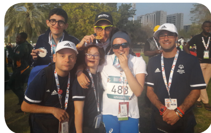
L'amicizia e lo sport sono il collante che ci tiene uniti... lo con alcuni compagni di avventura conosciuti a Dubai

Recentemente, sempre con Special Olympics, ho svolto un corso assieme a mio fratello