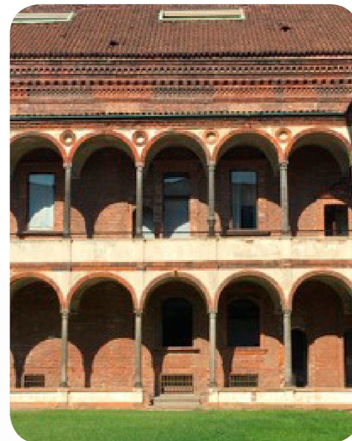
Particolare della facciata nel cortile dei Bagni, Ca' Granda Università Statale. Epoca rinascimentale. Realizzato su progetto di Filarete.