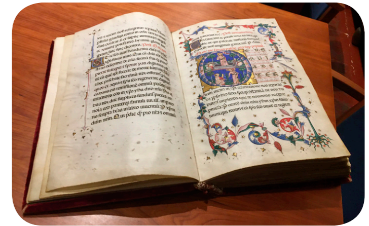
Miniatura su manoscritto detto incunabolo conservato presso il Palazzo Aricivescovile a Milano di fianco al Duomo.